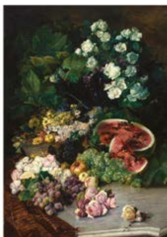
Fragment de 'Flors i fruits lleidatans' (1884), obra de Jaume Morera. Fons del Museu d'Art Jaume Morera.

A més, es preveu que el nou Museu Morera també aculli exposicions temporals, atansant una perspectiva més àmplia de la cultura actual; i que incorpori discursos museogràfics que vagin més enllà dels eixos cronològics, oferint visions més transversals. Les obres del nou museu les està executant l'UTE formada per Arnó, Sorigué i Romero Polo.