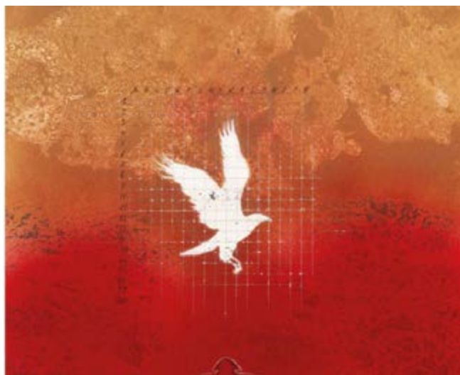
Fragment de 'Sense títol' (1977), obra de Rosa Siré. Fons del Museu d'Art Jaume Morera.

Un cop finalitzades, es preveu la implementació de la museografia i el trasllat de les col·leccions. El pressupost del projecte supera els sis milions d'euros i compta amb la complicitat i el finançament de l'Ajuntament de Lleida, la Diputació de Lleida, la Generalitat de Catalunya, el Ministeri de Foment (a través de l'1,5% Cultural) i de la Unió Europea (a través dels Fons Feder).