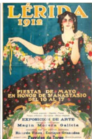
Fragment de 'Cartell de Festa Major' (1912), obra de Xavier Gosé. Fons del Museu d'Art Jaume Morera.

Un cop finalitzades, es preveu la implementació de la museografia i el trasllat de les col·leccions. El pressupost del projecte supera els sis milions d'euros i compta amb la complicitat i el finançament de l'Ajuntament de Lleida, la Diputació de Lleida, la Generalitat de Catalunya, el Ministeri de Foment (a través de l'1,5% Cultural) i de la Unió Europea (a través dels Fons Feder).