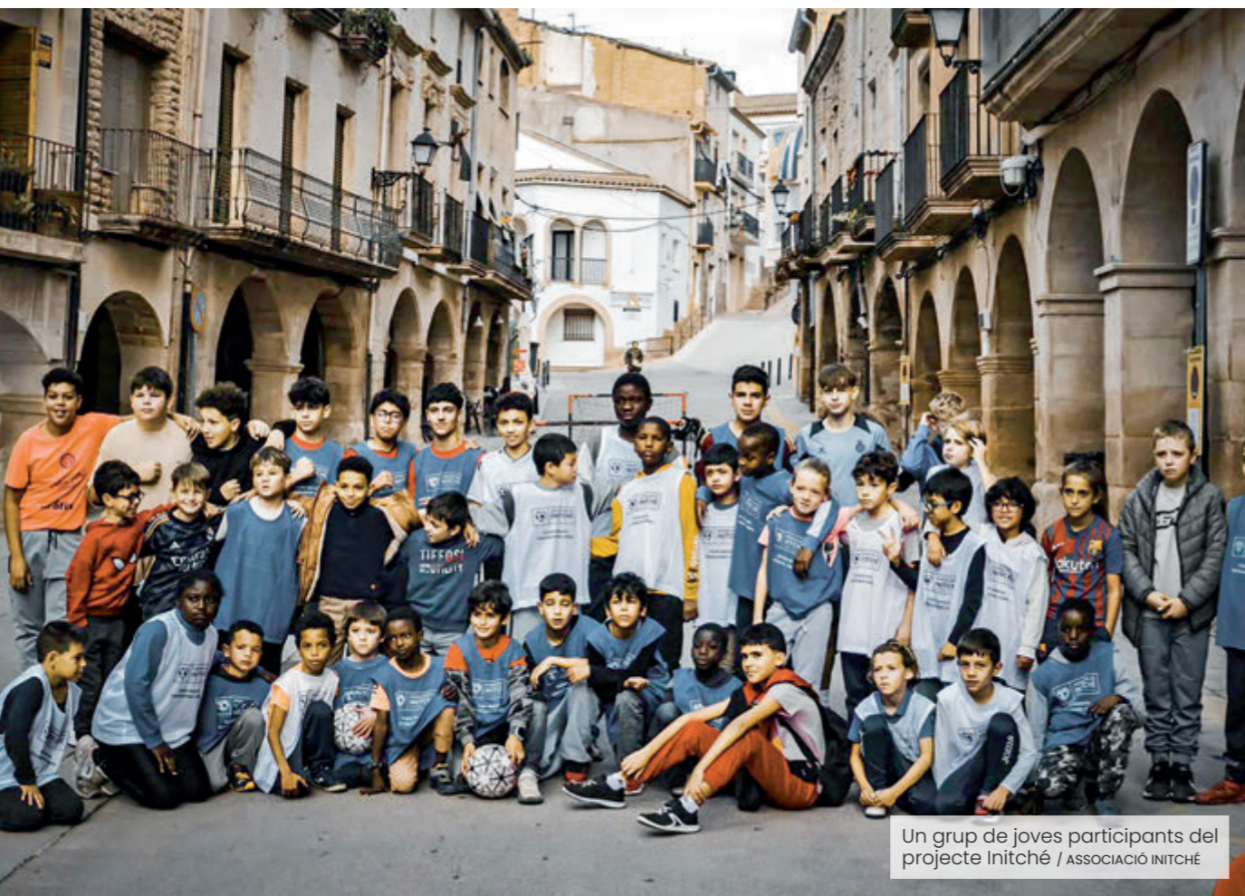
Un grup de joves participants del projecte Initché

Amb els anys, aquella proposta inicial s'ha convertit en una entitat consolidada, reconeguda també com a ONG, que articula una xarxa de suport basada en la implicació del