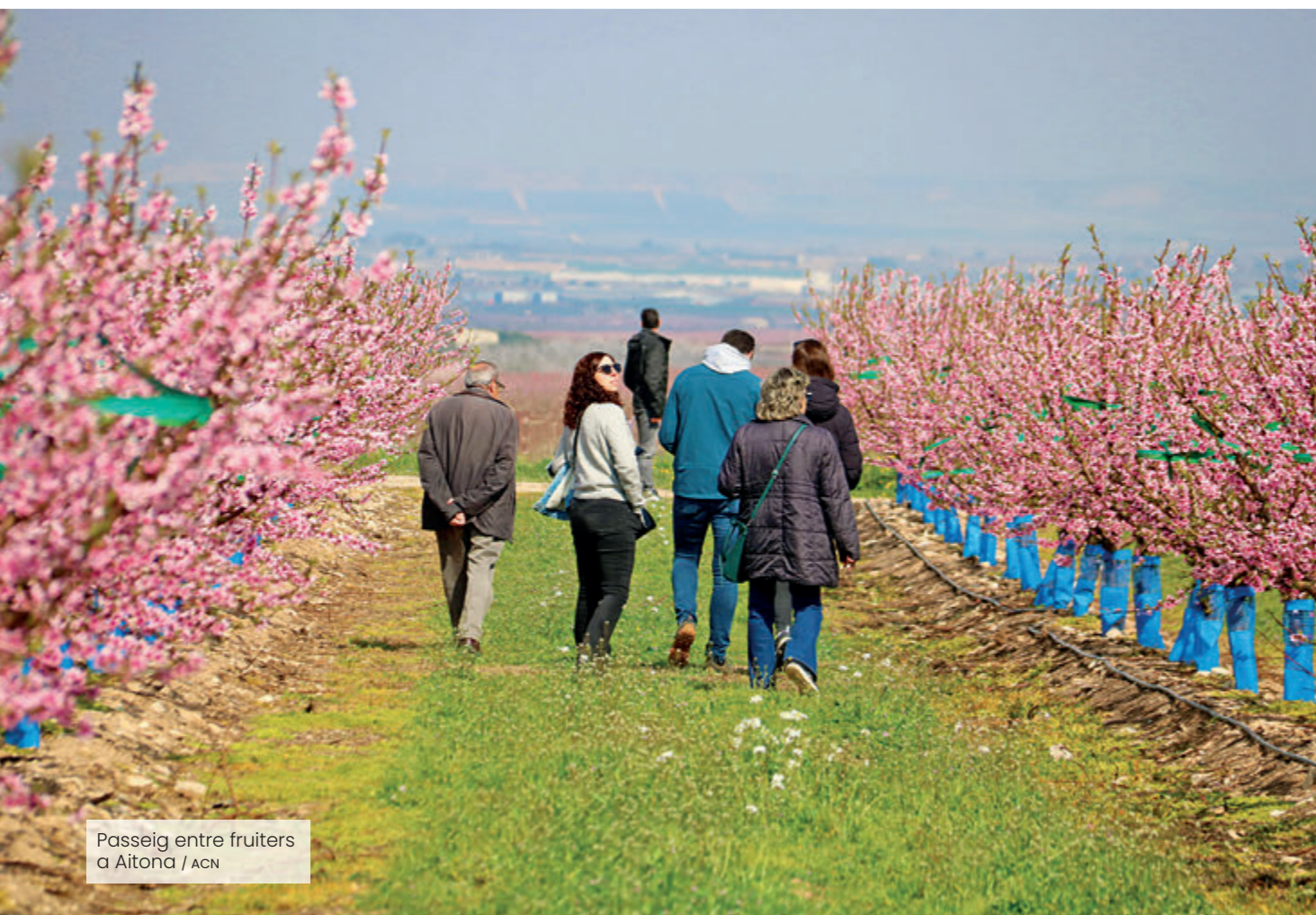
Passeig entre fruiters a Aitona

La campanya turística de la floració es consolida a les terres de Ponent amb més de 20.000 visitants