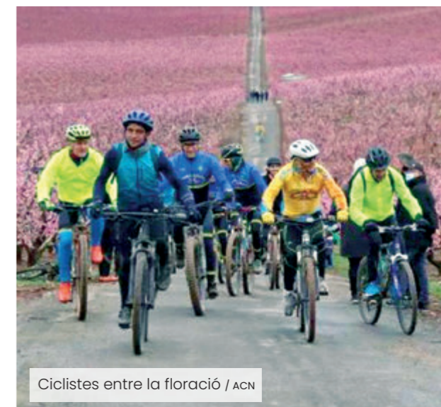
Ciclistes entre la floració