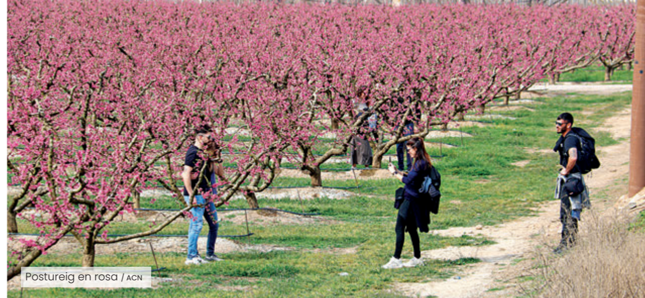
Postureig en rosa

La boira de primera hora de l'albada va voler ser la primera convidada aquell diumenge al matí a les terres de Lleida; però va ser una presència fugaç i gairebé poètica, que es va anar retirant a mesura que el sol guanyava alçada sobre l'horitzó per deixar pas a l'espectacle que milers de persones esperaven amb ganes des de feia mesos. Aquell mar infinit de tons rosats, des d'aquell cap de setmana, ja va inundar el paisatge d'Aitona i de bona part de la comarca del Segrià.