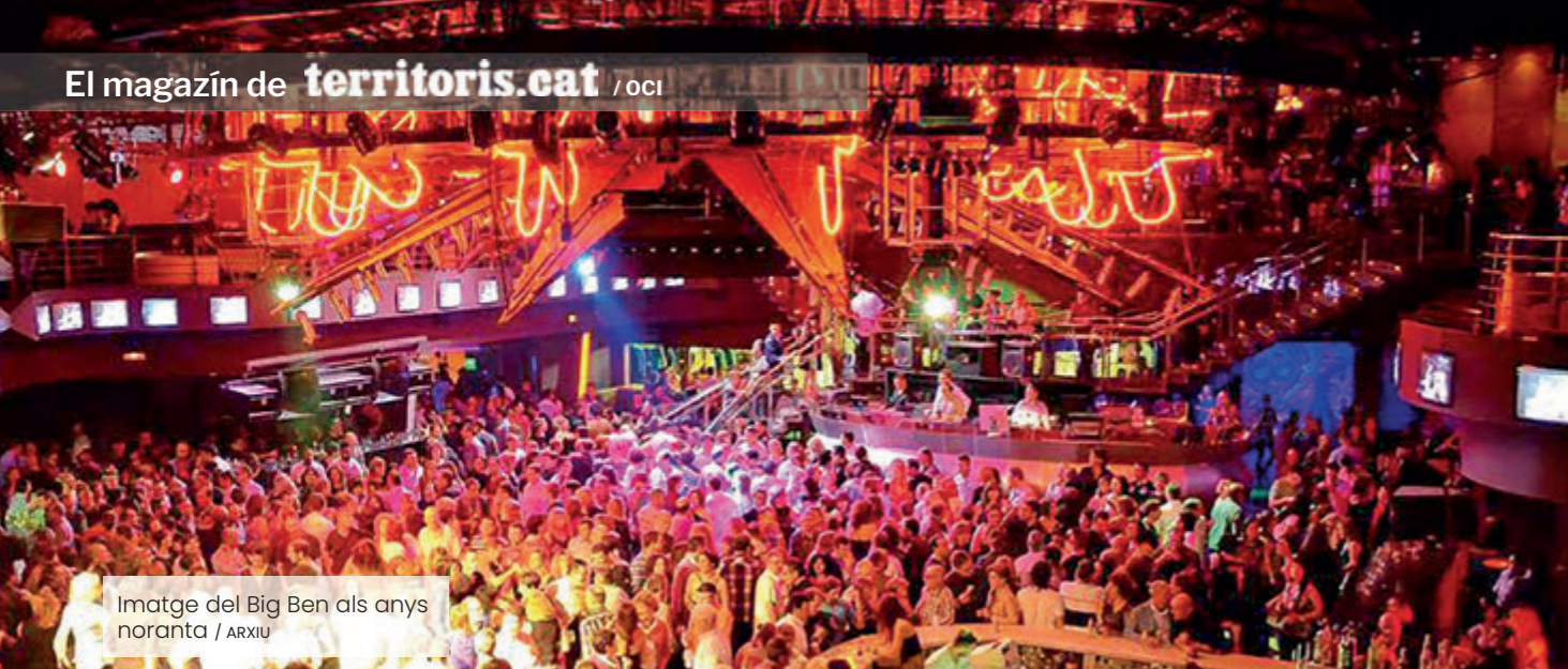
Imatge del Big Ben als anys noranta

va anar esquerdant per la suma de la tragèdia dels accidents de trànsit, l'enduriment necessari de la seguretat viària i la fragmentació del lleure", explica l'autor del llibre. El gegant va entrar en una agonia lenta, un crepuscle que va durar des de 2005 fins al silenci final de 2015. Durant una dècada, la llàntia immòbil i coberta per un vel de pols va ser el testimoni mut d'aquell món analògic i col·lectiu que s'extingia, definitivament, davant la llum blava i solitària de la pantalla dels telèfons mòbils.