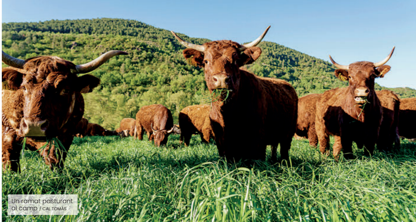
Un ramat pasturant al camp / CAL TOMÀS

L'experiència de l'agricultura i la ramaderia regenerativa