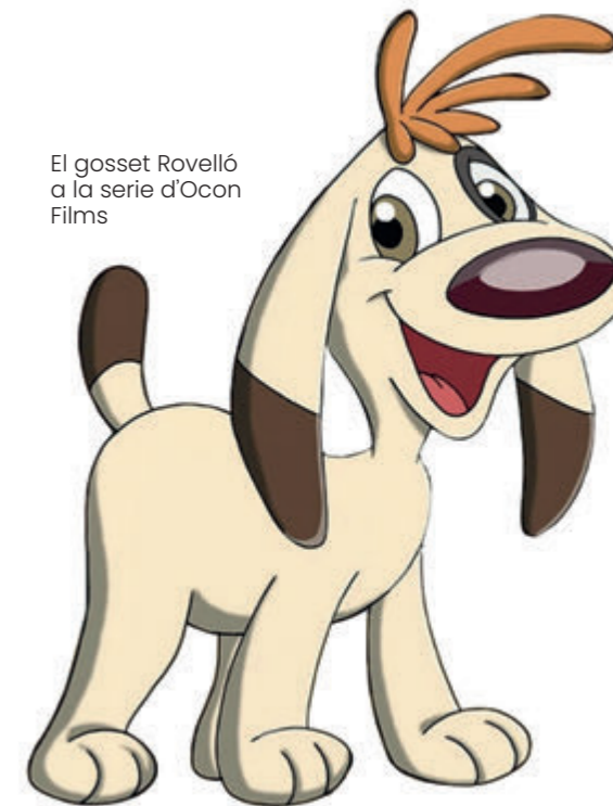
El gosset Rovelló a la sèrie d'Ocon Films

considera inseparable del seu compromís amb la llengua i la cultura, un compromís que encara conserva i que mantindrà ara, en la seva serena vida al costat del Segre i als peus de l'església de Santa Maria de Balaguer.