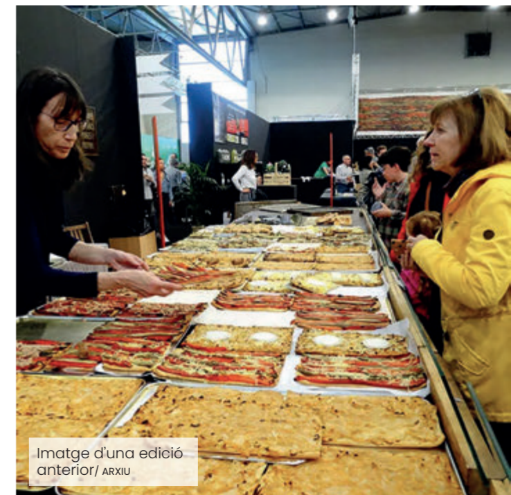
Imatge d'una edició anterior

La fira inclourà també activitats familiars, amb l'espai infantil Menuts Q, tallers i propostes lúdiques. A més, es