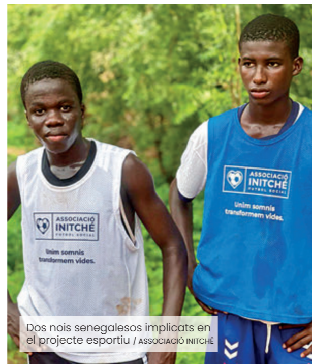
Dos nois senegalesos implicats en el projecte esportiu