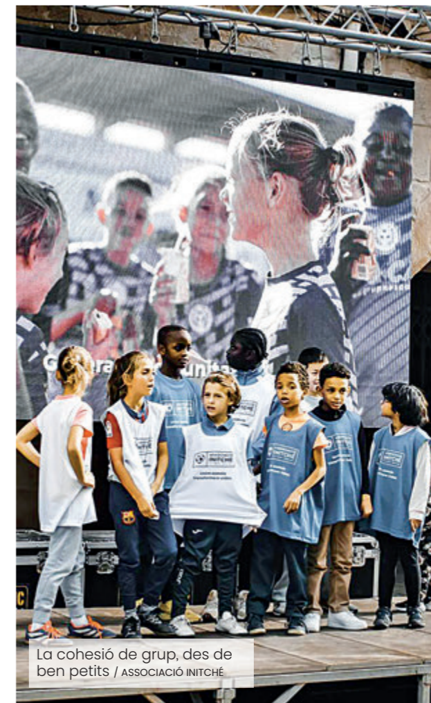
La cohesió de grup, des de ben petits / ASSOCIACIÓ INITCHE

territori. El finançament prové principalment de socis, empreses i col·laboradors locals, que han entès que la cohesió social també es construeix des de les pistes esportives.