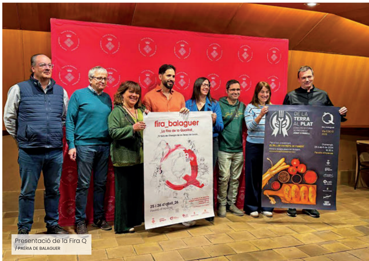
Presentació de la Fira Q

La ciutat de Balaguer acollirà els dies 25 i 26 d'abril una nova edició de Fira Q, la Fira de la Qualitat, un esdeveniment de referència