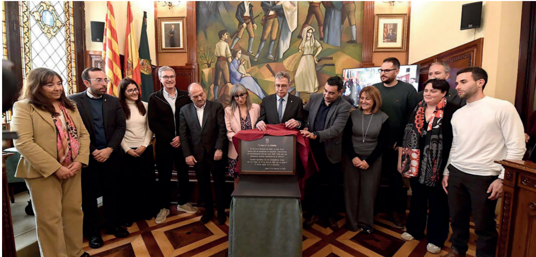
Imatge de la placa de record als funcionaris depurats a la Diputació