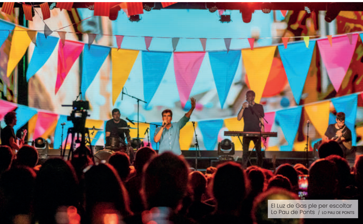
El Luz de Gas ple per escoltar Lo Pau de Ponts / LO PAU DE PONTS

El cantant i showman celebra els 10 anys de trajectòria musical amb una gira que recorrerà tot el país en els mesos vinents