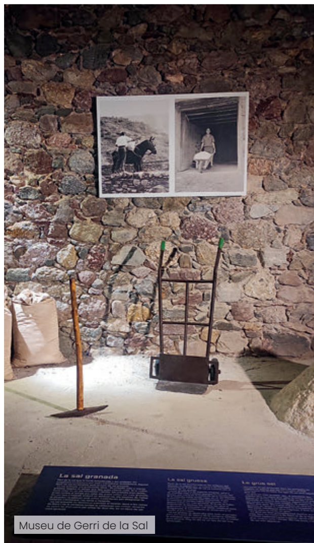
Museu de Gerri de la Sal

bar les exposicions “La força de l’aigua. El Dr. Pearson i les obres de la Canadenc a Lleida”, “Aigües del món” i “Joan Oró. El científic de la vida”. En segon lloc, el dipòsit del Pla de l’Aigua, el primer dipòsit d’aigües de la ciutat de Lleida, construït a finals del segle XVIII per garantir el subministrament d’aigua potable a la població. La tercera visita és a les fonts monumentals que en repartien l’aigua i que encara es conserven al Centre Històric de Lleida.