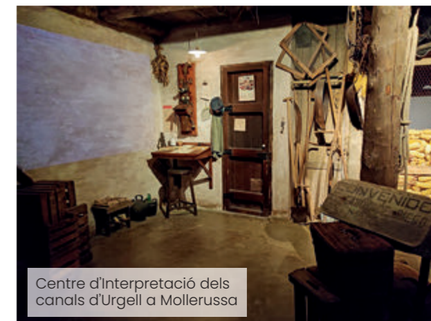
Centre d'Interpretació dels canals d'Urgell a Mollerussa

Sense deixar l'aigua, ens endinsarem en un altre museu que ens en parla. El Museu de l'Aigua el trobem a la ciutat de Lleida. S'hi programen visites a quatre espais diferents. El primer és el campament de la Canadenc, on podem tro-