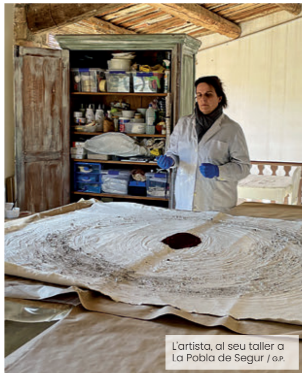
L'artista, al seu taller a La Pobla de Segur