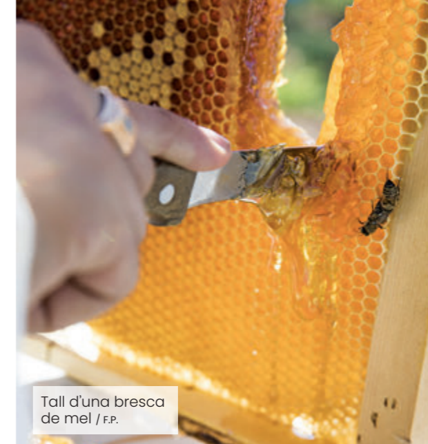
Tall d'una bresca de mel

Tants anys relacionant-se amb les abelles, ha après coses d'elles. "Em sorprèn molt la seva manera de treballar, són incansables", diu. També n'admira "la seva jerarquia, i