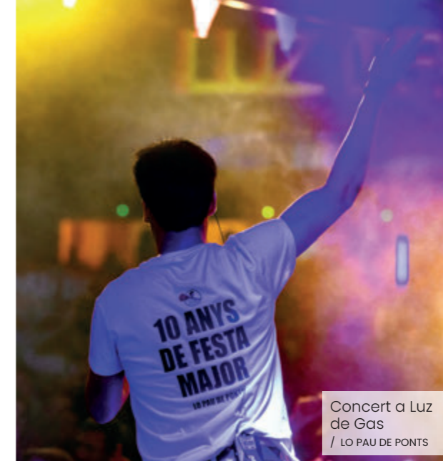
Concert a Luz de Gas / LO PAU DE PONTS

Per refermar aquesta connexió intergeneracional, l'artista destaca que entre el públic de la sala barcelonina s'hi trobava una nodrida representació de pontsicans, una "ambaixada" arribada expressament des de la seva terra natal. Aquest concert ha estat el tret de sortida d'una ambiciosa gira que, durant aquesta primavera i l'estiu, el portarà a recórrer la geografia catalana d'extrem a extrem.