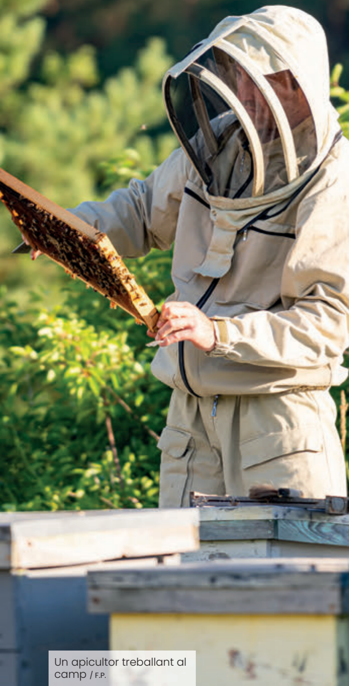
Un apicultor treballant al camp / F.P.