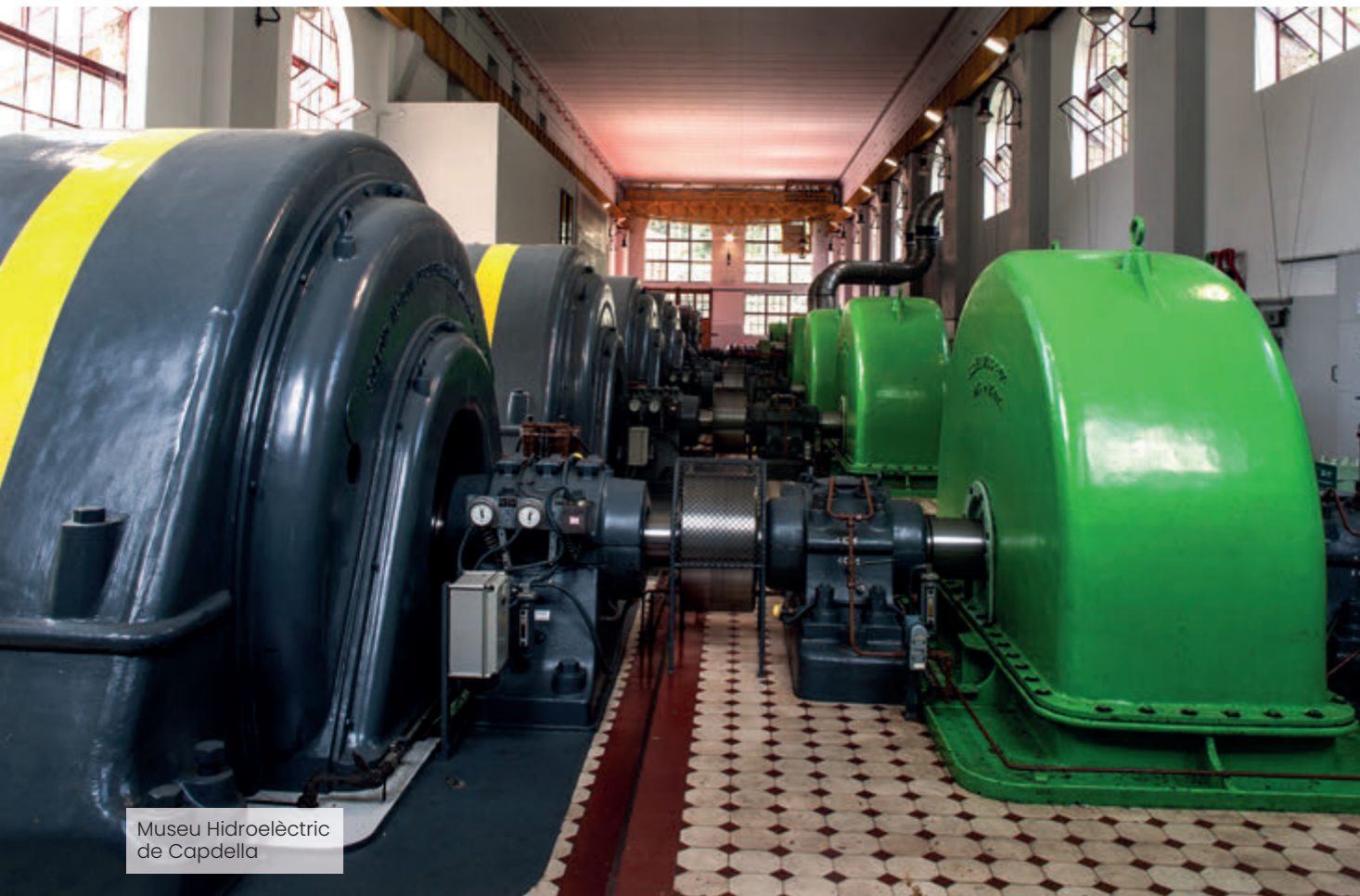
Museu Hidroelèctric de Capdella