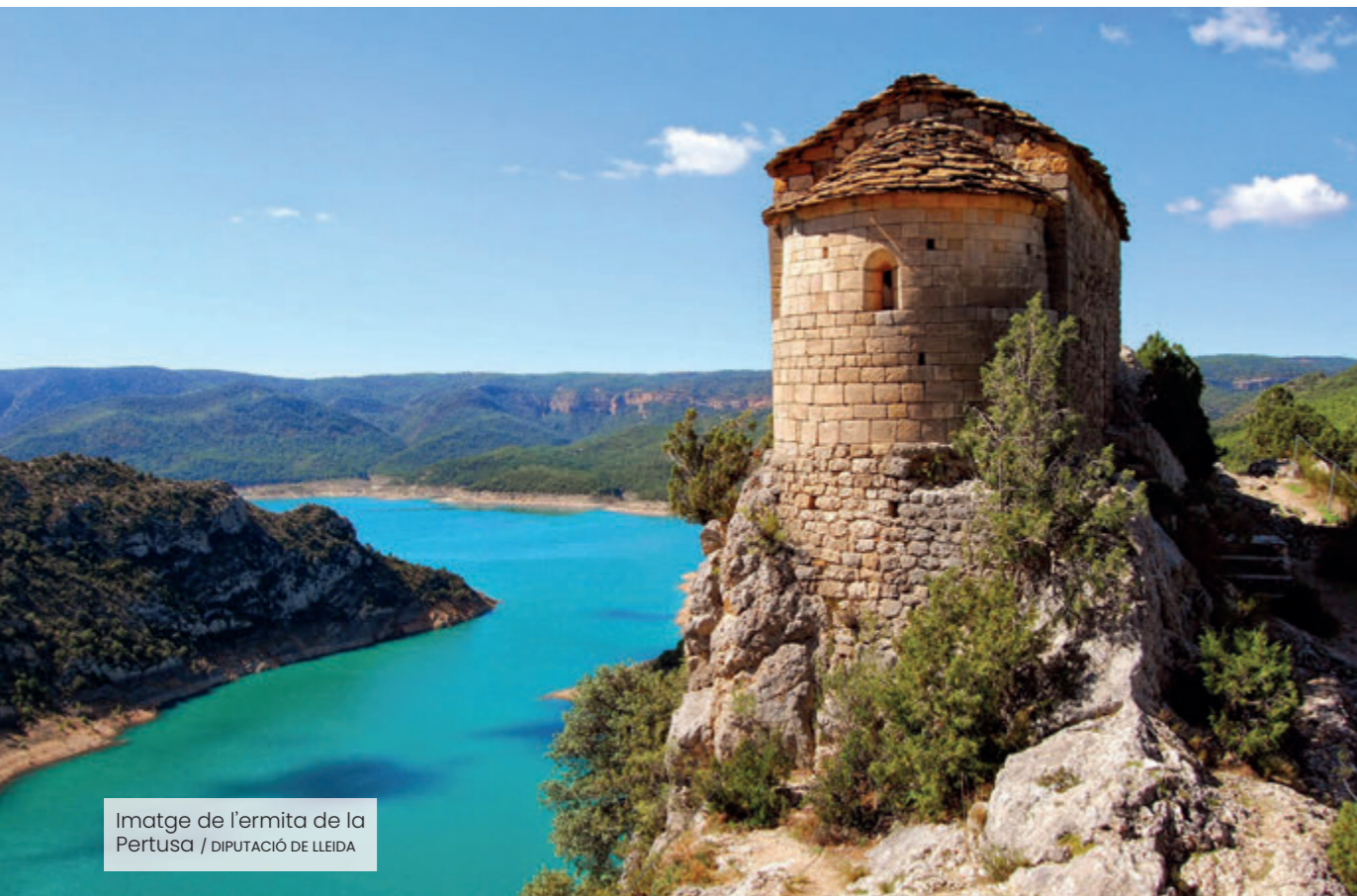
Imatge de l'ermita de la Pertusa