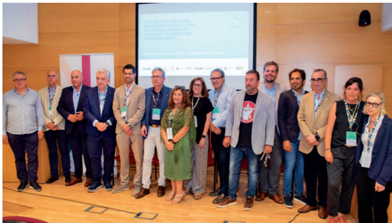
Presentació de la Declaració institucional del G10 rural

El territori converteix els seus recursos naturals en oportunitats econòmiques amb un model que combina sostenibilitat, innovació i indústria verda