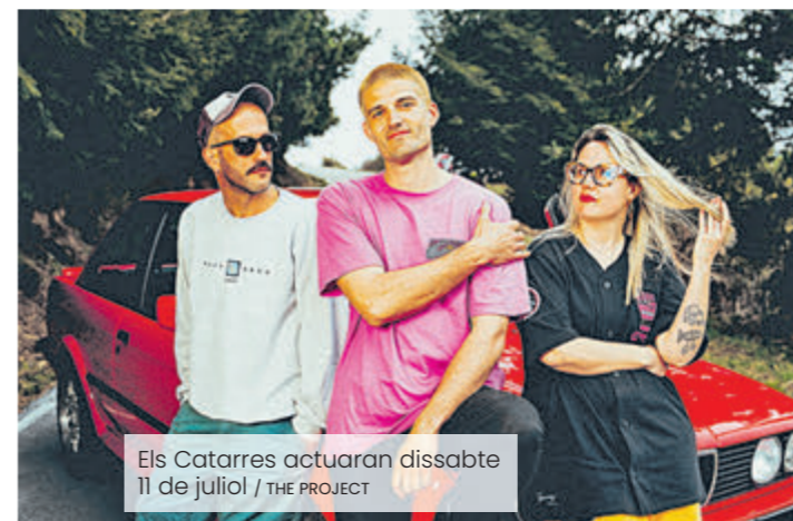
Els Catarres actuaran dissabte 11 de juliol / THE PROJECT

La Transsegre va néixer l'any 1984 impulsada per un grup de joves de Balaguer amb la voluntat de reivindicar el riu Segre i crear una activitat festiva vinculada al territori. Més de quatre dècades després, aquella iniciativa s'ha convertit en una de les celebracions més emblemàtiques de les Terres de Lleida. Tot i el seu creixement, la festa ha sabut mantenir els valors que la van veure néixer: el contacte amb la natura, la recuperació dels espais fluvials, la convivència i la promoció del territori. La vinculació amb el riu continua sent un dels trets diferencials de la Transsegre, que converteix el Segre en el gran protagonista de la celebració.