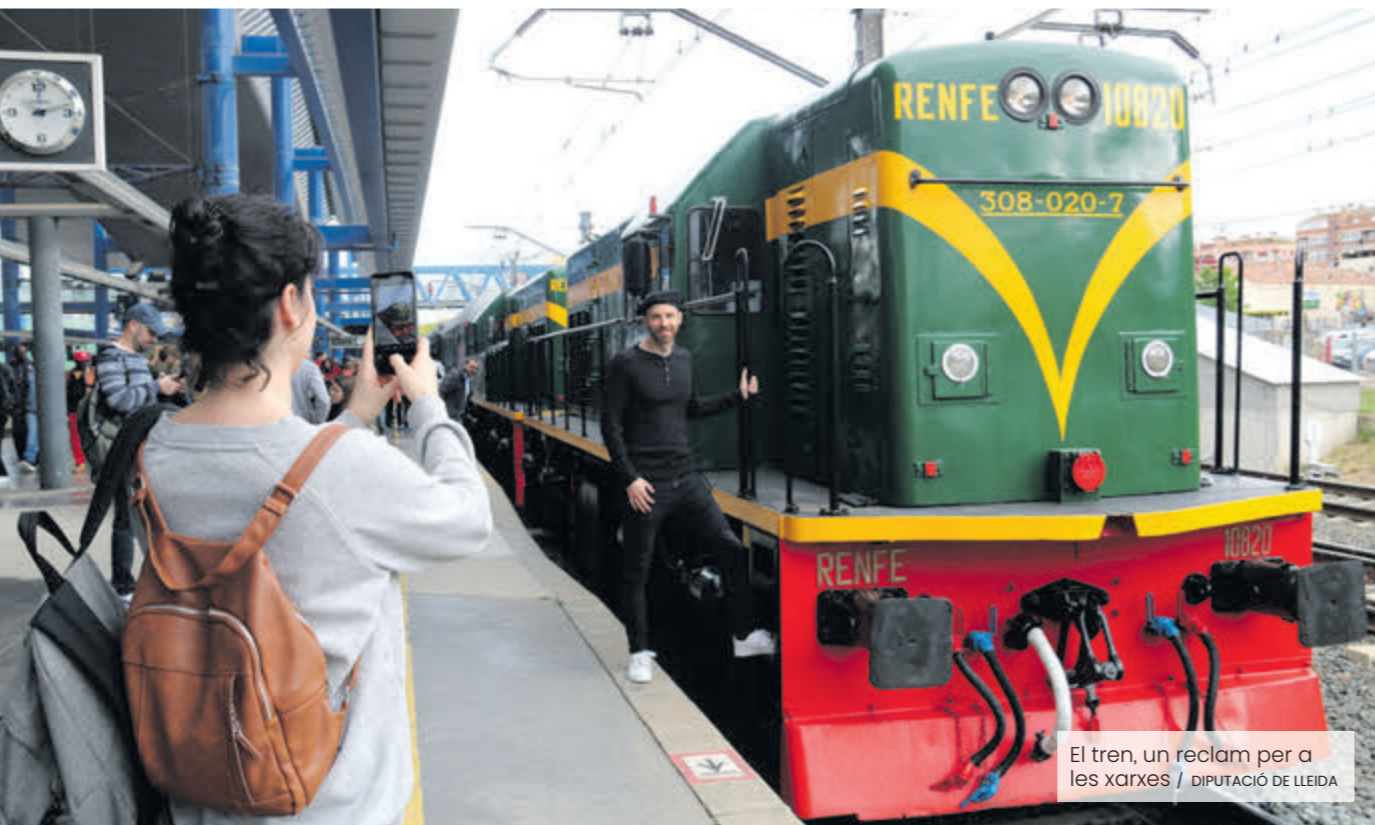
El tren, un reclam per a les XARXES / DIPUTACIÓ DE LLEIDA

Es preveuen 29 circulacions fins a l'octubre i s'estrena un nou passaport digital que premiarà els viatgers que completin recorreguts en diversos trens turístics de FGC