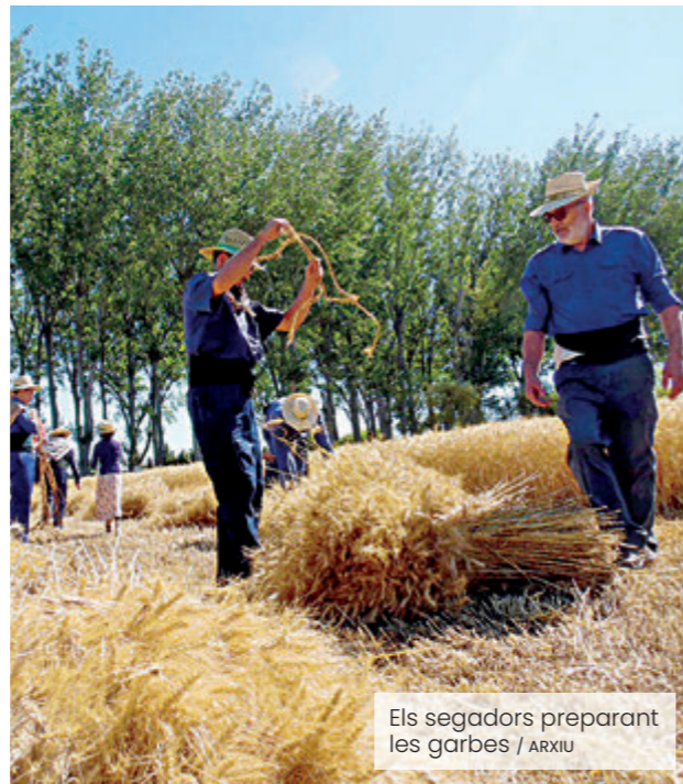
Els segadors preparant les garbes

La Festa del Segar i el Batre de la Fuliola és una de les celebracions de cultura popular i patrimoni agrari més destacades de les terres de Lleida. Organitzada des de l'any 1980, la festa té com a objectiu preservar i divulgar les feines tradicionals que durant segles van marcar la vida de la pagesia catalana abans de l'arribada de la mecanització al camp. La celebració es divideix en dues jornades principals. La primera recrea la sega del cereal, una tasca que antigament es feia manualment amb dalla o falç. Els participants mostren com es tallava el blat, com s'agrupaven les espigues en garbes i com aquestes es carregaven als carros per ser transportades fins a l'era. La segona jornada estava dedicada al batre, el procés que permetia separar el gra de la palla. Aquesta feina es duia a terme a les eres utilitzant animals, màquines de batre històriques i diverses