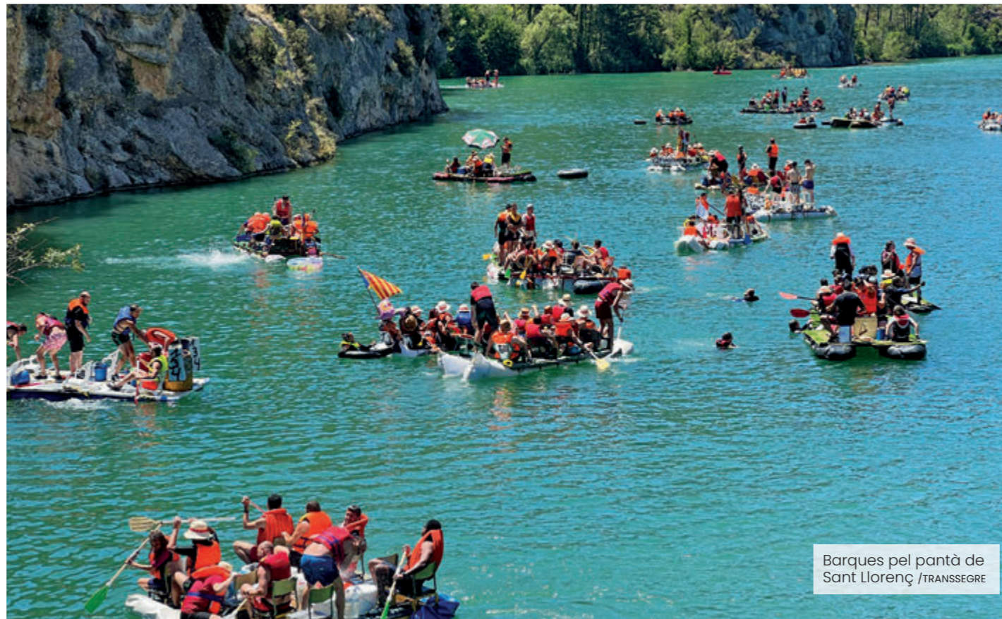
Barques pel pantà de Sant Llorenç